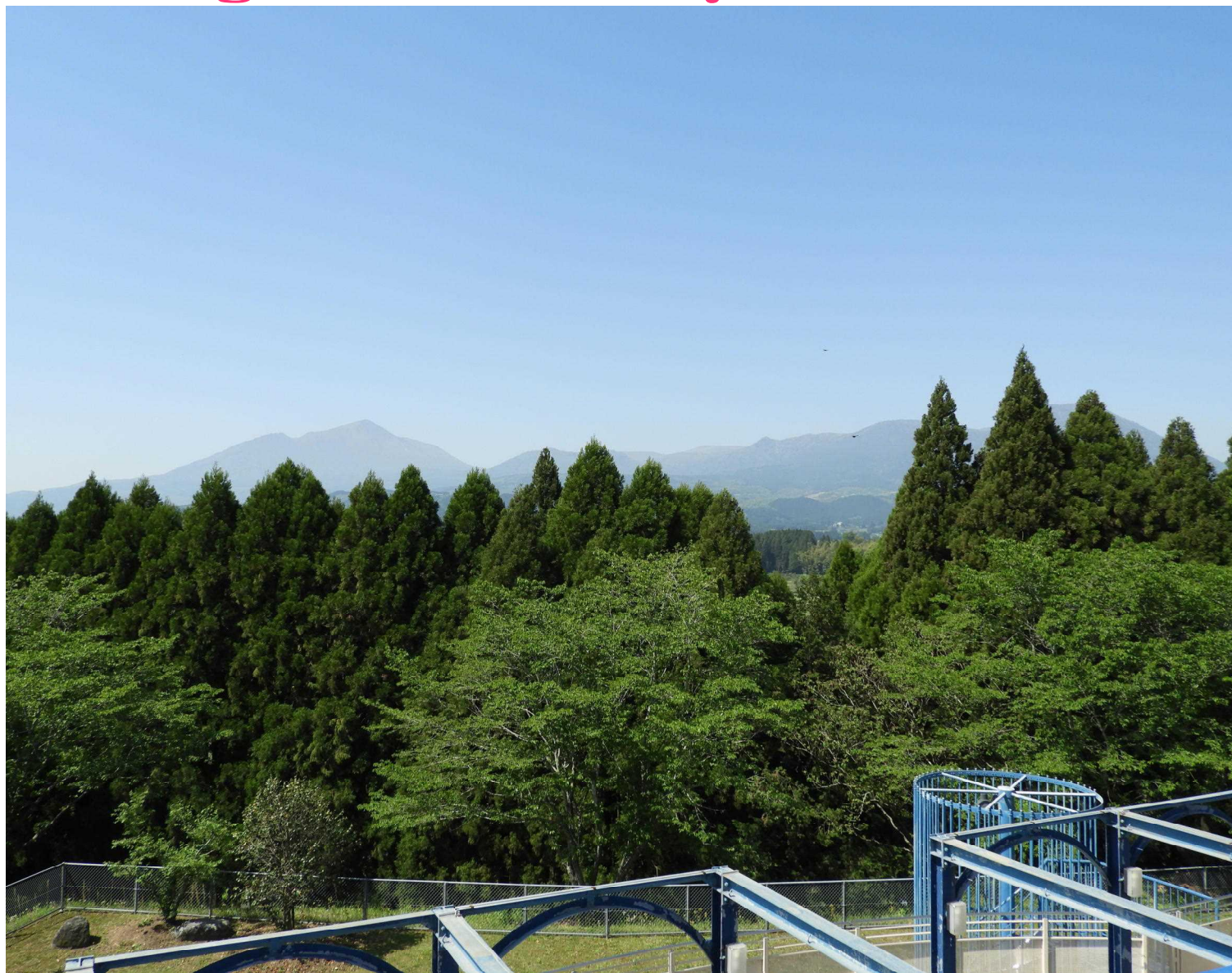
表紙:野菊の里から望む新緑の茂る風景(4月21日撮影)