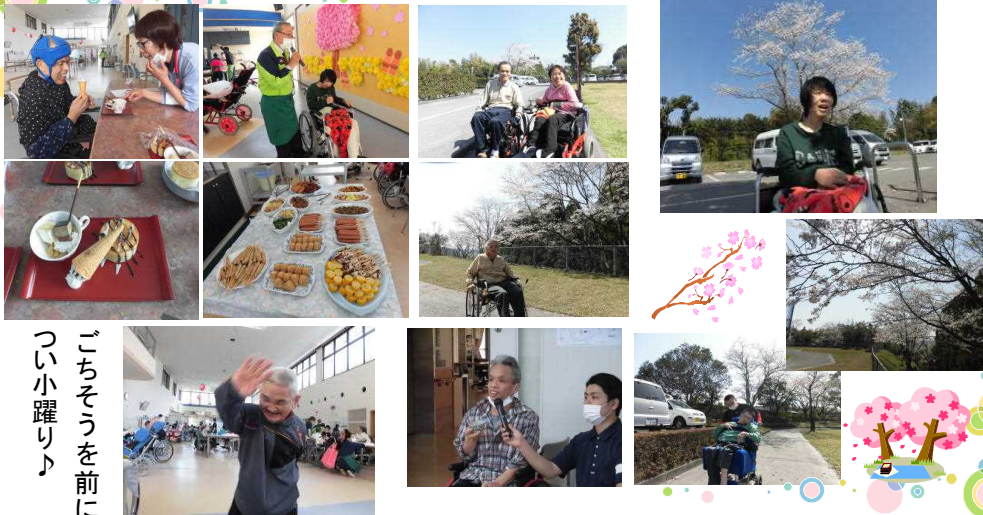
ごちそうを前に つい小躍り♪

三月二十八日、園内で花見を行いました。例年、満開に咲いた桜を見ながら外でバーベキューを行っていましたが、降灰の影響もあり花見をした後に、室内でバーベキューをする事となりました。今年の冬は冷え込みが厳しく、花見の時期にはまだ桜が咲いていないのではないかと心配されましたが、見事に満開の桜を見る事が出来ました。