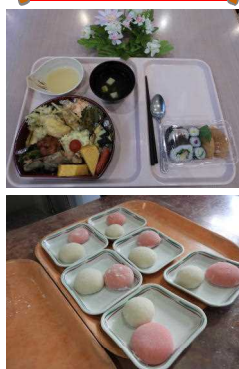
綺麗な色の 紅白餅！